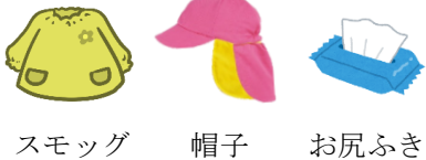
スモッグ 帽子 お尻ふき